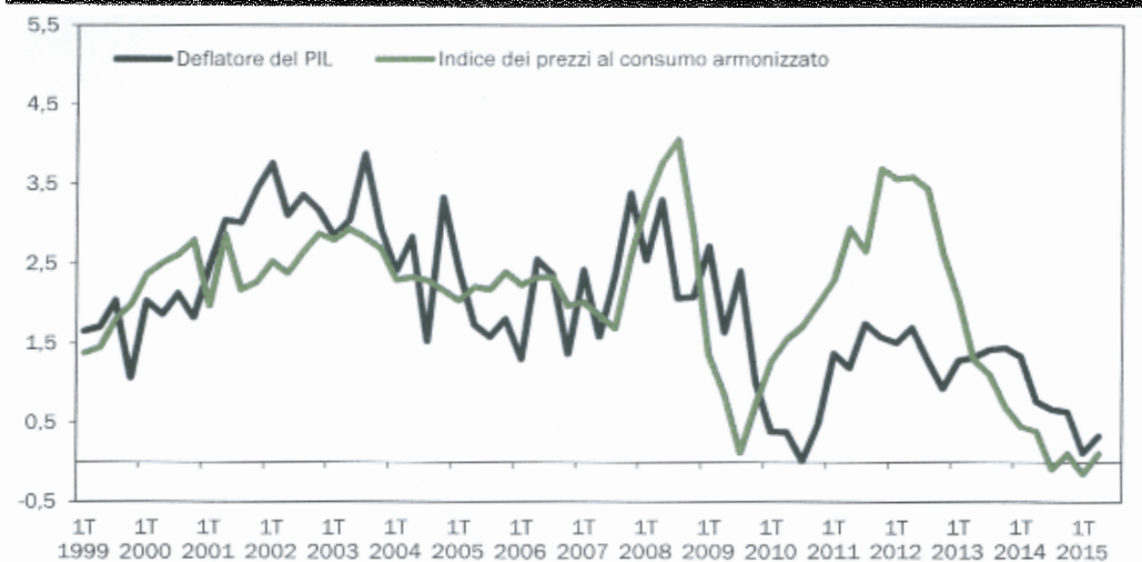
FIGURA 2: TASSI DI CRESCITA TENDENZIALI DEI PREZZI (variazioni percentuali)

A ciò si aggiunga che ulteriori implicazioni anche di tipo finanziario derivano dall'ondata di immigrazione proveniente dall'Africa e Medio Oriente, che vedono l'Italia come uno dei paesi più esposti in Europa. Le spese connesse ai