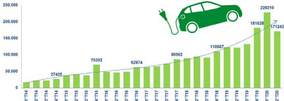
Grafico Area Studi e Statistiche ANFIA su dati ACEA