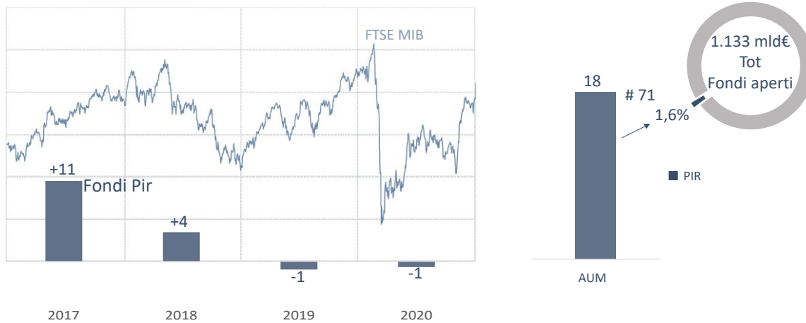
Figura 1. Fondi aperti PIR compliant . Patrimonio gestito e raccolta netta. Miliardi di euro, 2017-2020.

L'impatto dei PIR sui segmenti di mercato azionario meno capitalizzati è stato più che positivo: a fine 2020, le partecipazioni detenute dai piani di risparmio rappresentano il 10% del flottante del segmento AIM e il 9% dei segmenti Small Cap e Mid Cap. In termini assoluti le risorse ammontano a quasi 4,5 miliardi.