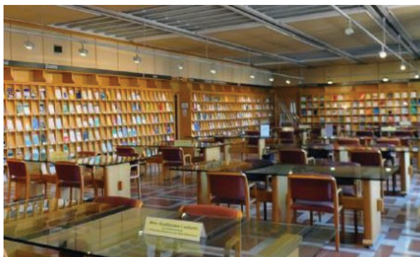
Salle des périodiques