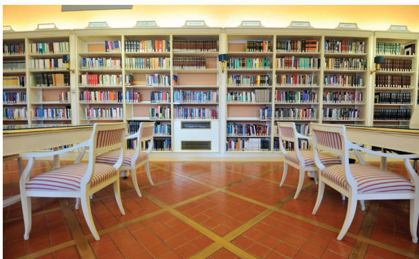
Salle de la législation étrangère

Elle organise régulièrement des expositions bibliographiques, ainsi que, en collaboration avec d'autres organismes intéressés, des visites du complexe dominicain de la Minerva ( Insula sapientiae ).