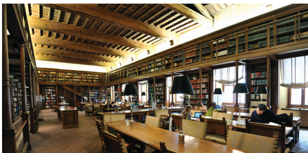
Sala delle Capriate (Salle des Chevrons)

En 1871 , avec les 22 000 volumes de ses collections, elle sera installée au deuxième étage du Palais Montecitorio au siège de la Chambre du nouveau Royaume d'Italie, où elle est restée jusqu'en décembre 1988 , date d'ouverture au public et du transfert au Palais de Via del Seminario, dans l'aire de l'ancien couvent des dominicains de Santa Maria sopra Minerva.