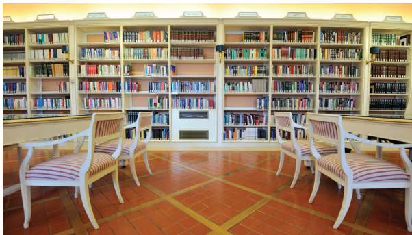
Sala de la Legislación Extranjera

Realiza periódicamente exposiciones bibliográficas, así como visitas al complejo de los Dominicos de la Minerva ( Insula sapientiae ), en colaboración con las demás instituciones implicadas.