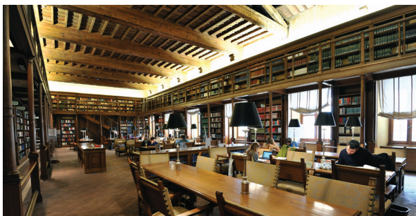
Sala delle Capriate (Salón de las Armaduras de Cubierta)

En 1871 , con los 22.000 volúmenes de que constaban sus colecciones, encontró acomodo en la segunda planta del palacio de Montecitorio , en la sede de la Cámara del nuevo Reino de Italia, donde permaneció hasta diciembre de 1988 , cuando se abrió al público y se trasladó al Palacio de Via del Seminario , en el área del antiguo convento dominico de Santa Maria sobre Minerva.