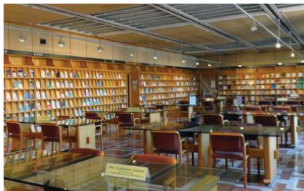
Sala de Revistas